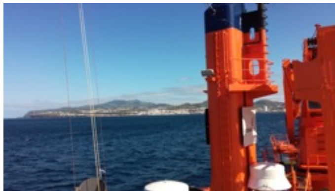
Ein (vorerst) letzter Blick auf Ponta Delgada auf den Azoren.