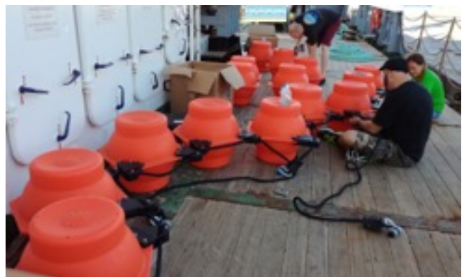
Die Auftriebskugeln für die Verankerung werden vor dem Auslaufen sicher an Deck vertäut.

Unser Projekt dient dazu, diese Ausbreitung und Vernichtung von Gezeitenenergie im Innern des Ozeans besser zu verstehen und in Klimamodellen zu berücksichtigen. Wir untersuchen dazu die Verteilung von